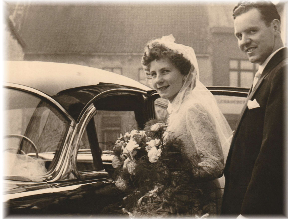
Begrafenissen Hermans - Baasrodestraat 1 te Baasrode - 052 33 33 37 - www.begrafenissenhermans.be